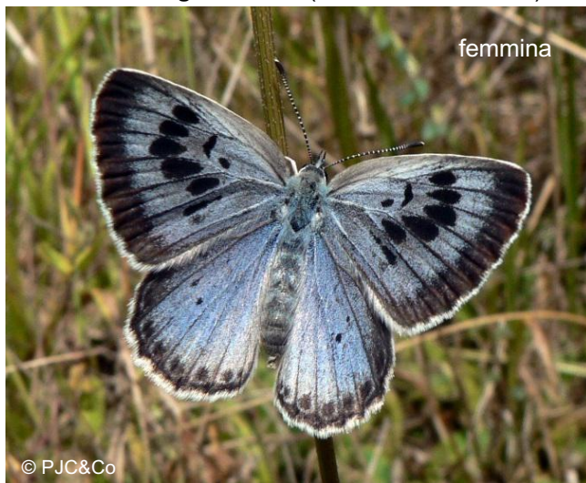
Adulti di Phengaris arion (ali in visione dorsale)

Biologia ed ecologia: P. arion è una specie xerotermofila associata a pendii aridi ed erbosi dal livello dal mare fino a 2000 m s.l.m.; è una specie mirmecofila, in cui la larva per completare il suo sviluppo ha bisogno di nutrirsi di uova e larve di formiche del genere Myrmica all'interno di formicai, producendo in cambio per gli adulti un secreto zuccherino e ricco di aminoacidi. Durante le prime fasi di sviluppo invece le larve si nutrono di diverse specie del genere Thymus . L'impupamento avviene nelle parti più superficiali dei formicai. Gli adulti volano in una sola generazione tra la fine di maggio e l'inizio di agosto in dipendenza della latitudine e dell'altitudine. La specie è presente in Italia continentale e peninsulare fino alla Sila, con esclusione delle isole.