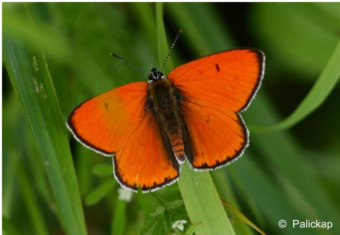
Maschio di Lycaena dispar