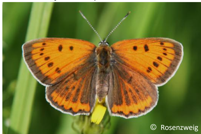
Femmina di Lycaena dispar