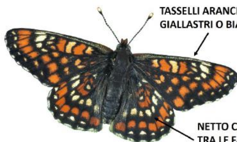
visione ventrale

TASSELLI ARANCIONI, GIALLASTRI O BIANCHI